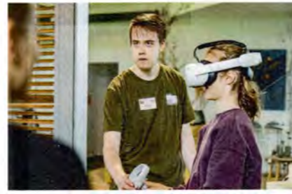
! Eine VR-Brille kostet um die 500 Euro und damit lassen sich beeindruckende Werkstatt-Touren erstellen.