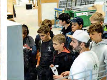
! Spannende Eindrücke können die Berufswahl der potenziellen Auszubildenden positiv beeinflussen.