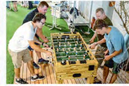
! Eine lockere Atmosphäre schafft Raum für ehrliche Gespräche. Ein Kickerturnier eignet sich da perfekt.