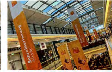
! In Einkaufszentren, auf Festen oder auf dem Marktplatz erwartet Sie niemand – hier sind Sie richtig.